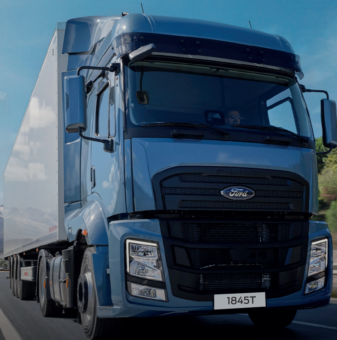
Photo non contractuelle. Equipements selon version. Dans la limite du stock disponible.